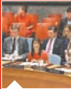
राष्ट्रीय 17. अंतरराष्ट्रीय 24.