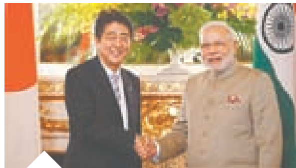
विश्व संबंध 31.